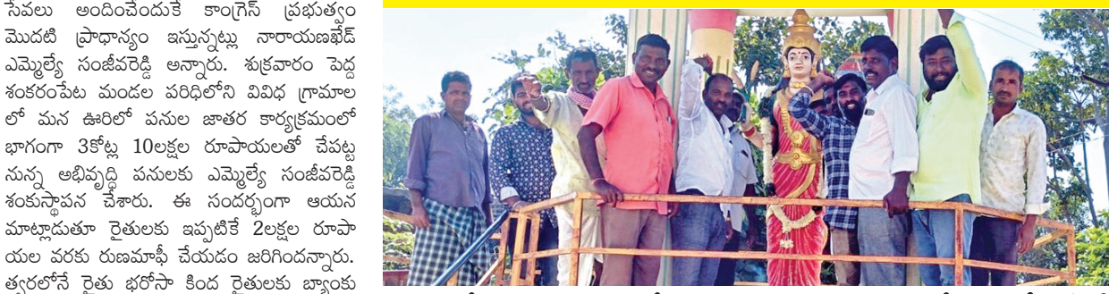
మన ఉరిలో పనుల జాతర కార్యక్రమంలో భాగంగా అభ్యర్థి పనులకు శంకుస్థాపన చేస్తున్న ఎమ్మెల్యే సంజీవరెడ్డి

పెద్ద శంకరంపేట, నవంబరు 29, ప్రభాతవార్త: ప్రజాసంక్షేమంలో పాటు మొదలైన విద్య, వైద్య సేవలు అందించేందుకే కాంగ్రెస్ ప్రభుత్వం మొదటి ప్రాధాన్యం ఇస్తున్నట్లు నారాయణభేడ్ ఎమ్మెల్యే సంజీవరెడ్డి అన్నారు. శుక్రవారం పెద్ద శంకరంపేట మండల పరిషత్ లోని వివిధ గ్రామాల లో మన ఉరిలో పనుల జాతర కార్యక్రమంలో భాగంగా 3కోట్ల 10లక్షల రూపాయలతో చేపట్టిన అభివృద్ధి పనులకు ఎమ్మెల్యే సంజీవరెడ్డి శంకుస్థాపన చేశారు. ఈ సందర్భంగా ఆయన మాట్లాడుతూ రైతులకు ఇప్పటికే 2లక్షల రూపాయల వరకు రుణమాఫీ చేయడం జరిగిందన్నారు. త్వరలోనే రైతు భోగానికి కింద రైతులకు బ్యాంకు ఖాతాలో డబ్బులు జమ చేస్తామన్నారు. అందరినీ వారందరికీ సుతర రేషన్ కార్డులను త్వరలోనే కాంగ్రెస్ ప్రభుత్వం మంజూరు చేస్తుందని పేర్కొన్నారు. గత పది సంవత్సరాల బిఆర్ఎస్ ప్రభుత్వ పాలనలో ఒకటి కూడా సూతర రేషన్ కార్డులు జమపడలేదని విమర్శించారు. నిరుపేద విద్యార్థులకు కార్టోరేట్ స్కూలులో విద్యను