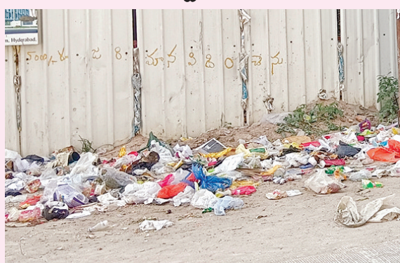
చెత్త వేయడాని బోర్డు పెట్టినప్పటికీ అక్కడ చెత్త వేసిన దృశ్యం

అమీన్ పూర్, నవంబరు 29, ప్రభాతవార్త: కాలనీలో అందరూ చదువుకున్న వ్యక్తలే.. కానీ చదువుకోని అక్షానులుగా వ్యవహరిస్తున్నారు. అమీన్ పూర్ మున్సిపాలిటీ పరిధిలో రామనంద్రపూర్ నుండి జయలక్ష్మీ నగర్ కాలనీకి వెళ్లే దారి పొడవునా తరచూ చెత్త వేయడంతో వాహన దారులు, పాదచారులు చెత్త, దుర్వాసనతో తీవ్ర ఇబ్బందులు పడుతున్నారు. మున్సిపల్ సిబ్బంది చెత్తను శుభ్రం చేయడం జరిగింది. తాజాగా ఇప్పటికే వెయ్యడాని, చెత్త వేసినట్టే 1000 రూపాయల జరిమానా విధించడం జరుగుతుందని, ఇది సిని కెమెరా పర్యవేక్షణలో ఉందని మున్సిపల్ అధికారులు పలుమార్లు హెచ్చరిక బోర్డులు ఏర్పాటు చేసినా కచ్చితంగా కనిపించిన కఠోరులైన వ్యవహారాన్ని చదువుకున్న అక్షానులు తమ తీరును మార్చుకోకుండా చెత్త వేయడం జరుగుతుంది. ఇప్పటికైనా వీరి తీరు మారుతుండా, లేదా వేచి చూడాలి.