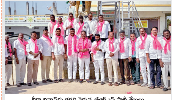
దీక్షా దినానికి తరలి వెళ్లిన బిఆర్ఎస్ పార్టీ శ్రేణులు

గుమ్మడిదల, నవంబరు 29, ప్రభాతవార్త: బిఆర్ఎస్ పార్టీ కార్యాలయంలో శుక్రవారం నిర్వహించిన దీక్షా దినాని కార్యక్రమానికి చహూసెరు నియోజకవర్గం ఉమ్మడి జిల్లారం మండల నాయకులు, కార్యకర్తలు తరలి వెళ్లారు.