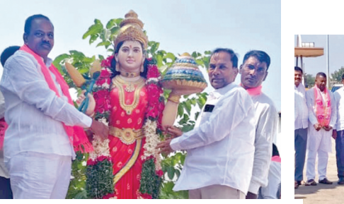
డిక్లరేషన్లో తెలంగాణ తల్లికి పూలమాల వేస్తున్న మాజీ ఎమ్మెల్యే