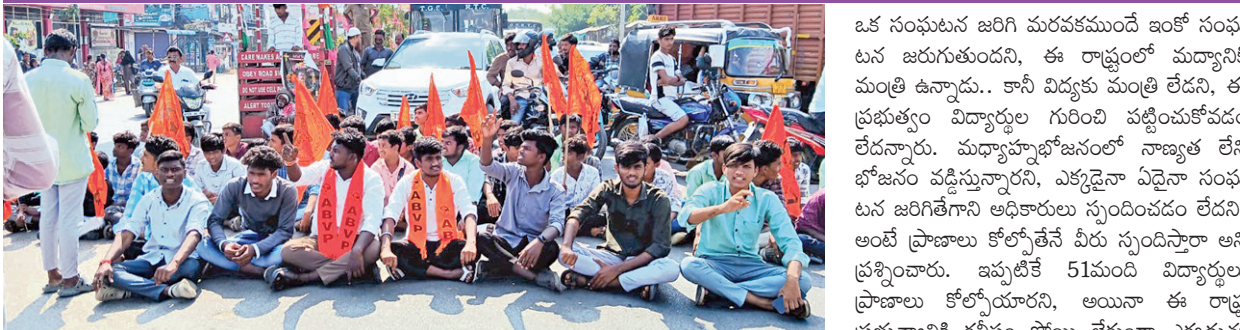
నిరసన తెలుపుతున్న బిజెపి నాయకులు

మెదక్ మున్సిపాలిటీ, నవంబరు 29, ప్రభాతవార్త: అలో వ విధంగా ఆడుకుంటే, ఈ ప్రభుత్వం కూడా విద్యార్థుల జీవితాలతో ఆడుకుంటుందని, కనీస పనులు లేక విద్యార్థులు అష్టకష్టాలు పడుతున్నారన్నారు. మధ్యాహ్న భోజనం పట్ల పట్టించుకోవడం లేక పాముల పాఠశాలల్లో విద్యార్థుల అత్యుపాత్యలను నిరసనగా నిరసన కార్యక్రమం నిర్వహించారు. ఈ సందర్భంగా వివిధ రాష్ట్ర సభ్యులు ఉదయం 8గంజీ మండ్లి విద్యార్థులు ఫుడ్ పాయిజన్ గురయ్యారని, వారు మృత్యువుని జయించి బతికారని అన్నారు.