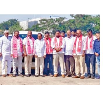
జహీరాబాద్ లో డిక్లరేషన్ చేయడం